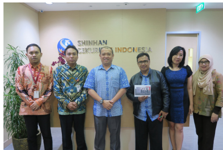
Kunjungan ke PT Shinhan Sekuritas