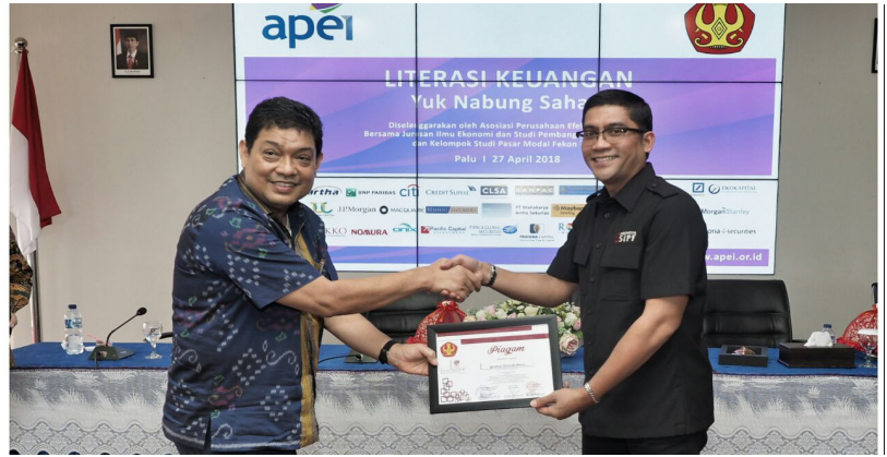
Narasumber pada acara Literasi Keuangan “Yuk Nabung Saham” Bersama Asosiasi Perusahaan Efek Indonesia (APEI)