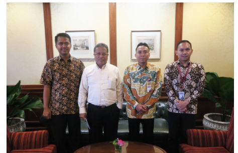
Kunjungan ke PT HSBC Sekuritas