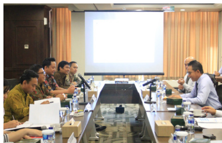
Studi Banding ke LPS