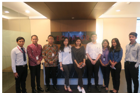
Kunjungan ke PT Equator Sekuritas