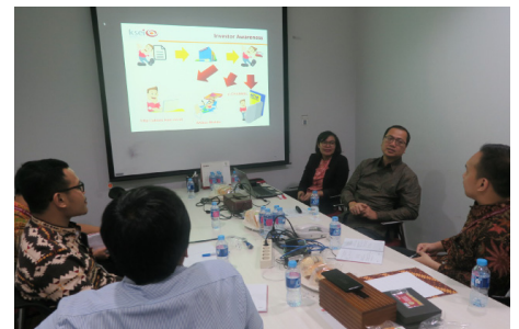
Sharing Session dengan KSEI