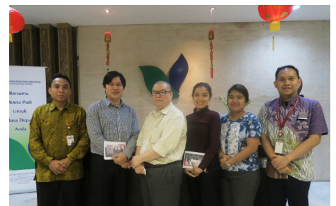
Kunjungan ke PT Minna Padi Investama