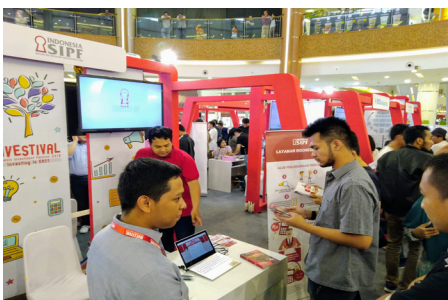
Investival 2018 Jakarta