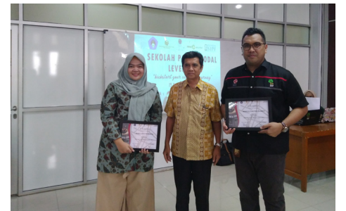
Narasumber di STIE Indonesia