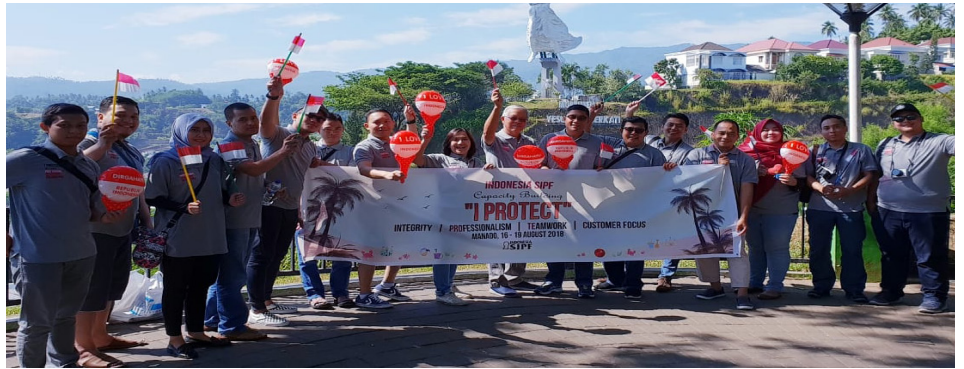
Capacity Building di Manado, Sulawesi Utara