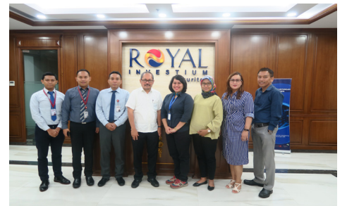
Kunjungan ke PT Royal Investium Sekuritas