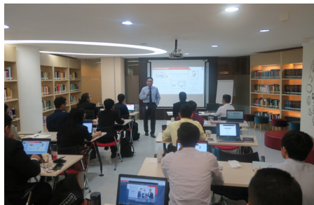
Narasumber di CMPDP