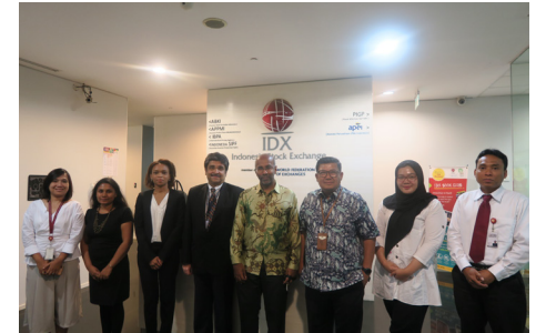
Sharing Session dengan ADB