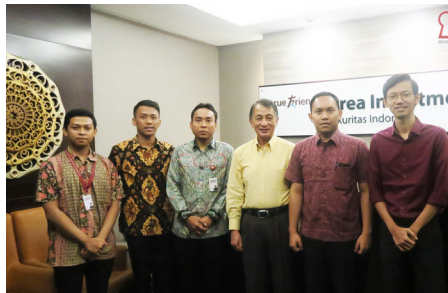
Kunjungan ke PT Korea Investment Sekuritas