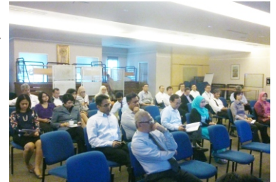
Sosialisasi Anggota DPP di Mandiri Sekuritas