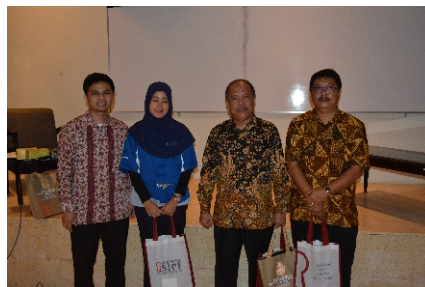
30 April 2014 - Sosialisasi di Atmajaya