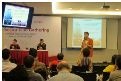
22 Februari 2014 - IDX Investor Gathering di Bursa Efek Indonesia