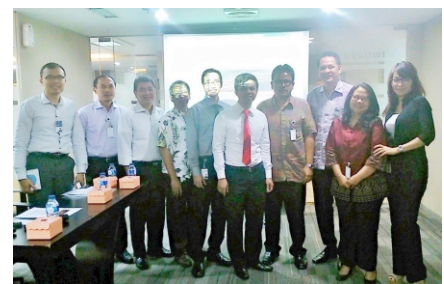
26 Februari 2014 - Sosialisasi di Mandiri Sekuritas