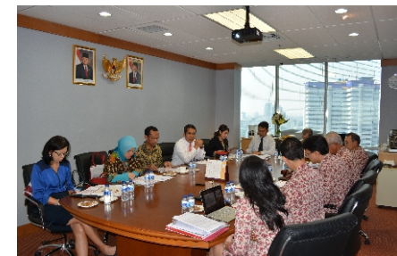
2 Juni 2014 - Rapat Umum Pemegang Saham Tahunan