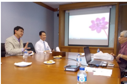
7 Februari 2014 - Sharing Session "Pengelolaan Investasi di Dana Pensiun"