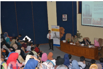
18 Maret 2014 - Sosialisasi kepada Civitas Akademika Fakultas Ekonomi Universitas Islam Negeri (UIN) Syarif Hidayatullah, Jakarta