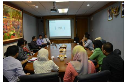
17 November 2014 - Kunjungan dari Tim Manajemen Risiko KPEI untuk Memahami Proses Bisnis P3IEI