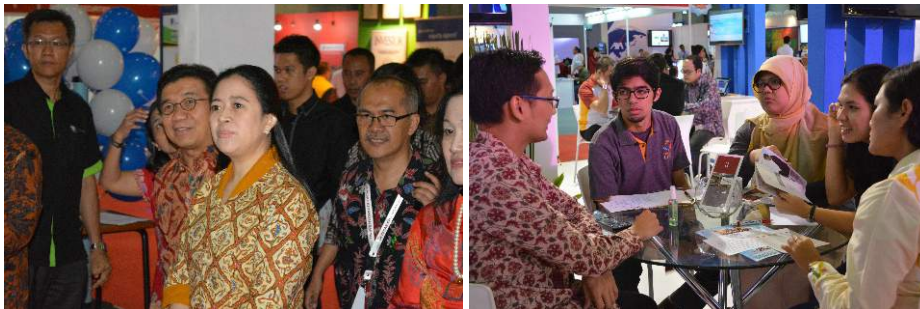
Pembukaan Pasar Keuangan Rakyat oleh Menteri Koordinator Pembangunan Manusia dan Kebudayaan, Ibu Puan Maharani