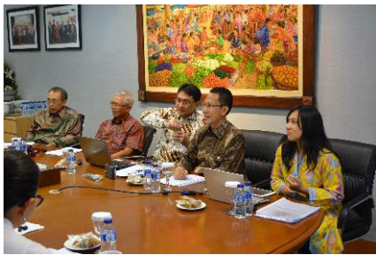
5 November 2014 - Rapat Umum Pemegang Saham Luar Biasa untuk Persetujuan Rencana Kerja dan Anggaran Tahunan 2015